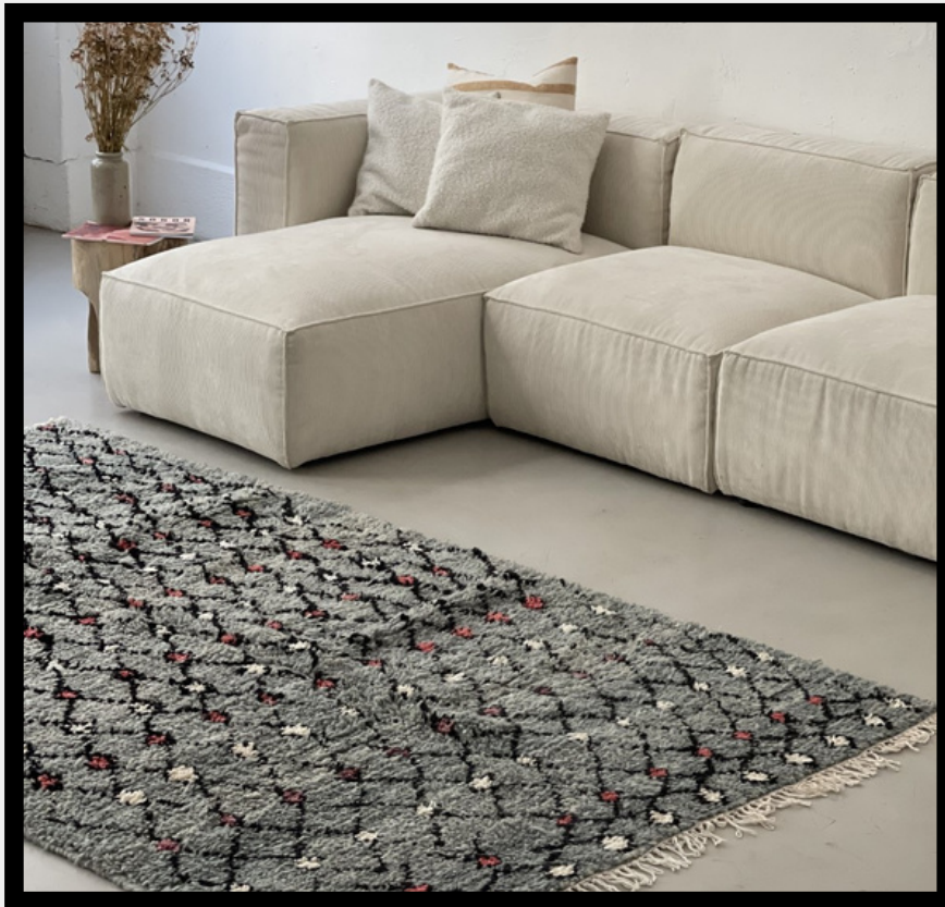
TAPIS BERBÈRE AZILAL • N°107