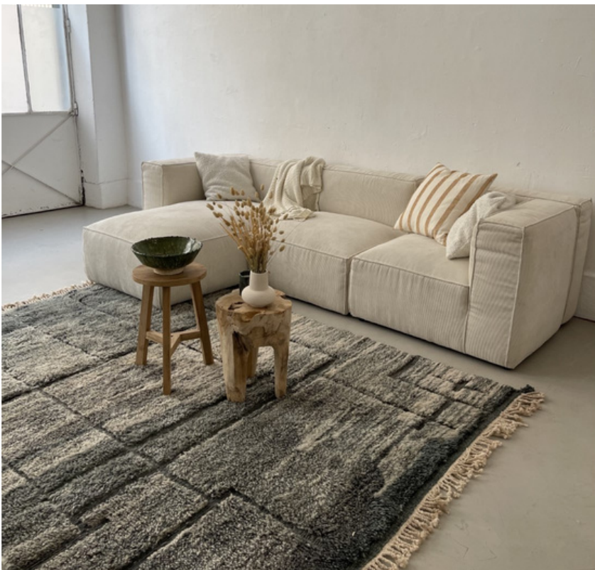
TAPIS BERBÈRE CHEKMIYA • N°142