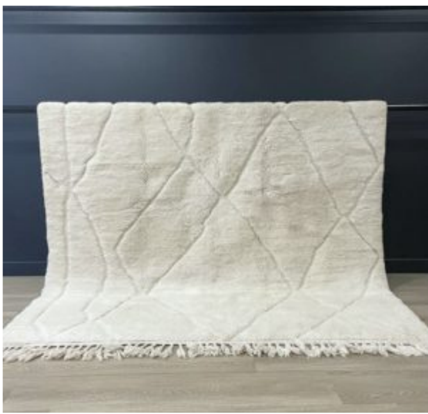
TAPIS BERBÈRE BÉNI OUARAIN • N°155