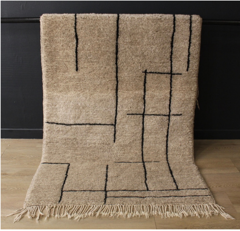
TAPIS BERBÈRE CHEKMIYA • N°105