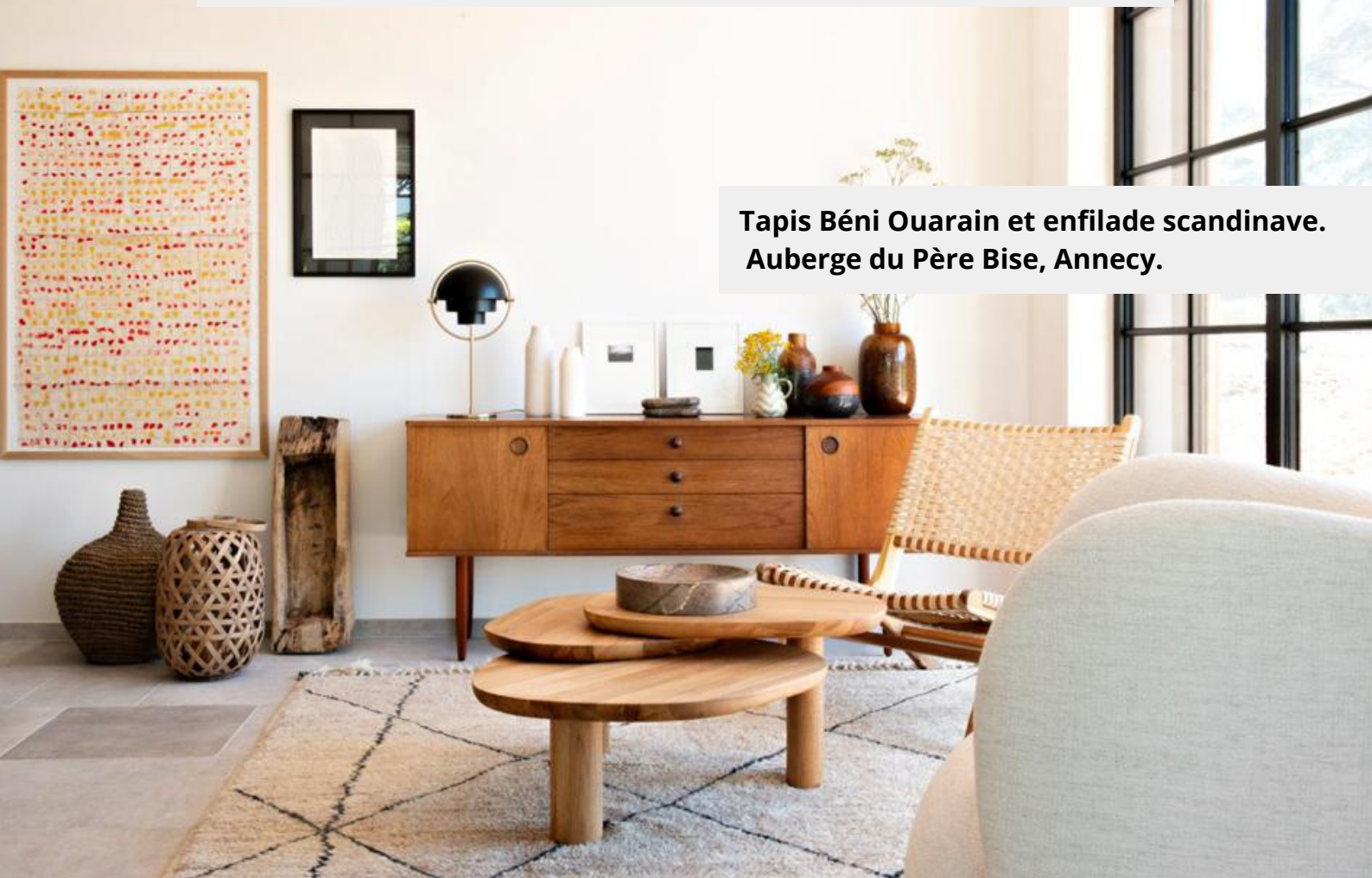
Tapis Béni Ouarain et enfilade scandinave. Auberge du Père Bise, Annecy.