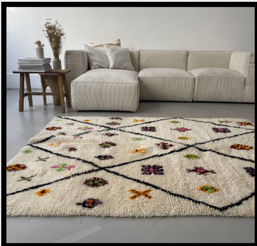
TAPIS BERBÈRE AZILAL • N°11