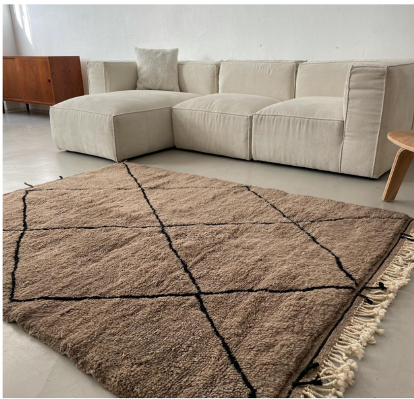
TAPIS BERBÈRE BÉNI OUARAIN • N°139