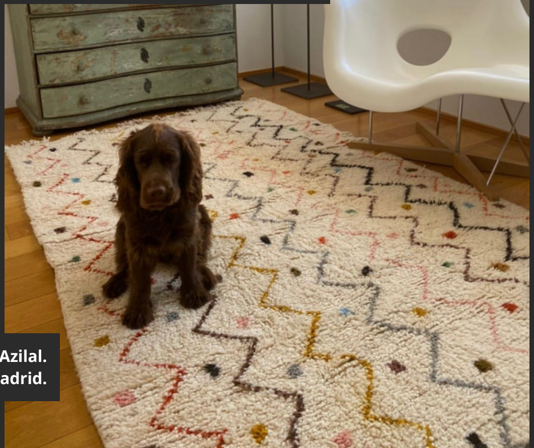
Tapis Azilal. Locaux de Juan Betere, Madrid.